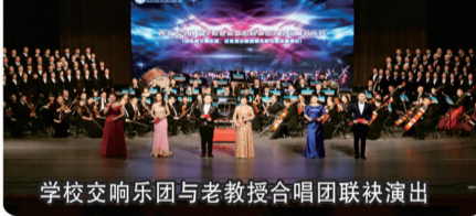
学校交响乐团与老教授合唱团联袂演出