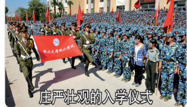
庄严壮观的入学仪式