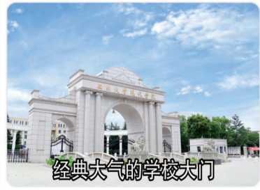
经典大气的学校大门