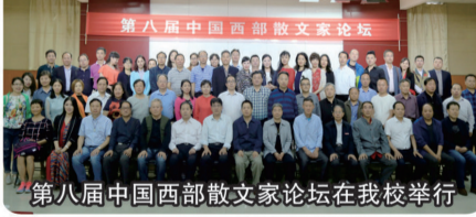
第八届中国西部散文家论坛在我校举行