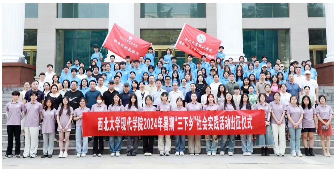
2024年暑期“三下乡”社会实践活动出征仪式。

在丹凤县，“三下乡”社会实践团队深入丹凤葡萄酒厂和丹凤公交公司，探寻企业发展路径，为其提供智力支持与创新思路助力。在丹凤葡萄酒厂，师生们参观先进的生产设备，了解葡萄酒的酿造工艺和市场营销策略。在与企业管理人员和员工的交流中，深入分析企业在品牌建设、产品创新等方面的优势与挑战，并提出了具有针对性的建议，助力企业提升核心竞争力。丹凤公交公司的调研聚焦于公共交通服务的优化和运营管理的改进。支教队通过实地考察、采访调查等方式，为公交公司提供了崭新的发展思路，以提升乡村公共交通的便捷性和舒适性。