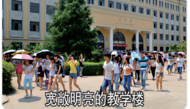
宽敞明亮的教学楼