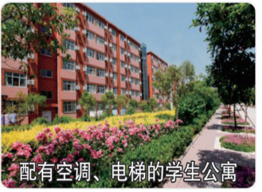
配有空调、电梯的学生公寓