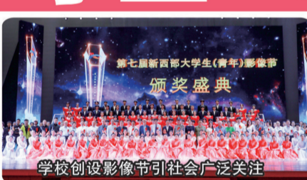
学校创设电影节引社会广泛关注

学校精心办学，品质兴学，正以坚实的步伐、卓越的作为，走内涵式发展道路，办人民满意大学，向着创建国内一流品牌型大学的目标高歌猛进！ (曹凤和)