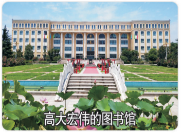
高大宏伟的图书馆