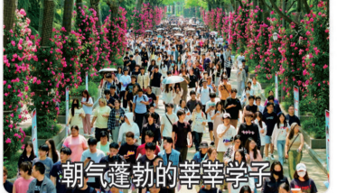
朝气蓬勃的莘莘学子