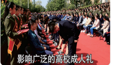
影响广泛的高校成人礼